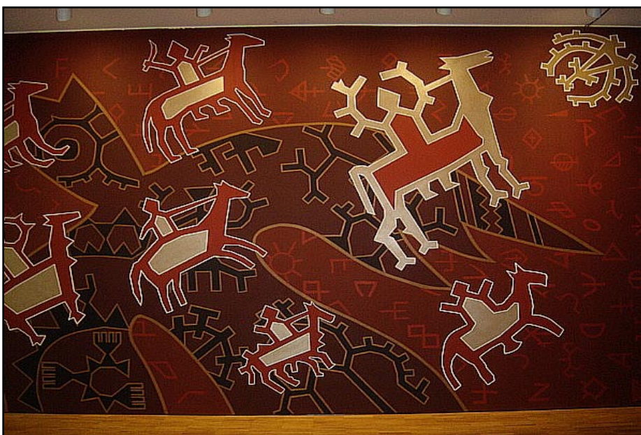
Павел Микушев расписал прямо на стене выставочного зала свои «Небесные скачки»

Искусство финно-угров, в большей части, своими корнями в народной мифологии, орнаментах и цветах национальной одежды, но одновременно это и современное искусство. В то же время один и тот же художник на выставке может быть представлен, как в духе социалистического реализма, так и этнофутуризма.