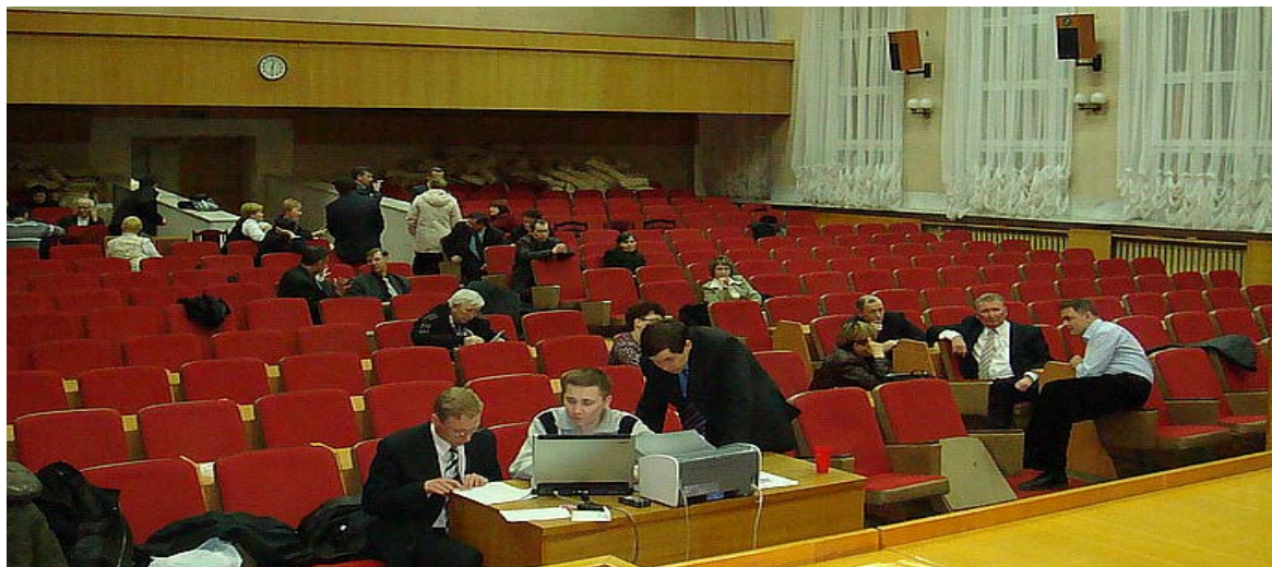
Выбор делегатов на конгресс в Йошкар-Оле закончился скандалом. Под конец большинство людей покинуло зал.