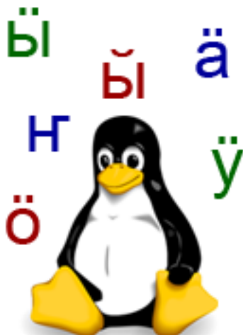
Коллаж: Васли Николаев

Эза Антикоски создал семью шрифтов Uralic, где верхняя часть шрифтов соответствует кодировке Windows 1251 и дополнительные кириллические знаки, необходимые для написания текстов на